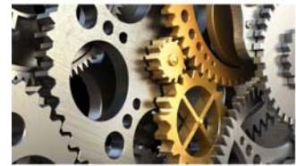
Industrie 4.0 in Eckpunkten Ein interdisziplinärer Querschnitt 2. Auflage | 20. November 2016